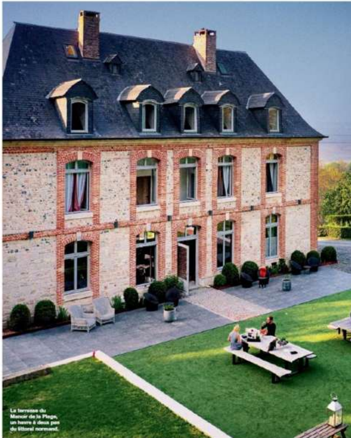
La terrasse du Manoir de la Plage, un havre à deux pas du littoral normand.